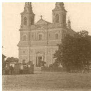
Zdjęcie archiwalne, kościół z trzema wieżami (dwie z przodu i sygnaturka)