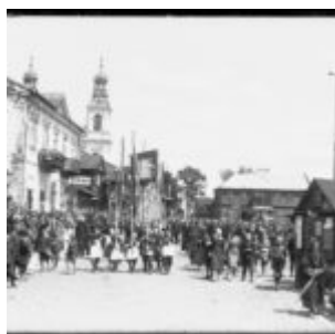
Procesja Bożego Ciała- zdjęcie archiwalne z 1932 r.